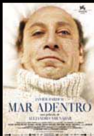
Mar adentro , d'Alejandro Amenábar (2004)