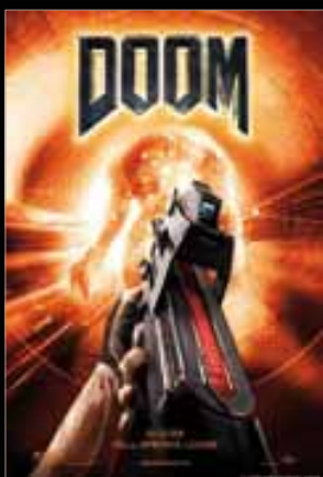
Doom , d'Andrzej Bartkowiak (2005)